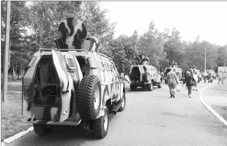
Бронеавтомобіль "Кугуар", озброєний автоматичним гранатометом, десантний відсік вміщує 8 осіб.